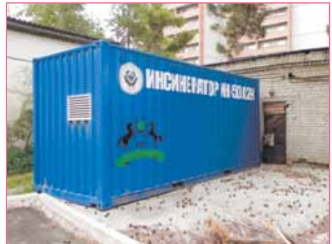
Фото 3. МСЗ ИН-50.02К (50 кг/ч) в Челябинске

Свое веское мнение по данному вопросу в 2012 г. высказал главный арбитр – государство, опубликовав доклад Росприроднадзора, одобренный Российской академией наук, «Обоснование выбора оптимального способа обезвреживания твердых бытовых отходов жилого фонда в городах России», в котором мусоросжигание было названо наиболее оптимальной и экологически безопасной технологией обезвреживания ТБО. При этом мы небезосновательно полагаем, что в настоящее время стала востребованной практическая плоскость определения оптимальных условий применения обоих способов (сортировки и сжигания) в одном цикле обезвреживания ТБО.