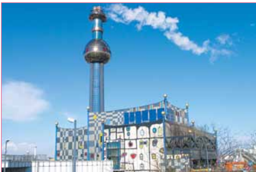
Фото 1. МСЗ «Шпиттелау» в центре Вены, Австрия

После опубликования в июле 2012 г. на сайте Федеральной службы по надзору в сфере природопользования доклада «Обоснование выбора оптимального способа обезвреживания твердых бытовых отходов жилого фонда в городах России» в редакцию стали приходить отклики на него. Один из них был опубликован в февральском номере журнала («ТБО» № 2, 2013 г., с. 46–49). Предлагаем ознакомиться с еще одним мнением наших читателей.