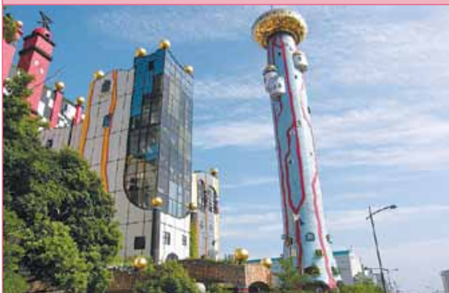
Фото 2. МСЗ в Осаке, Япония

В настоящее время в России большинство проектов обезвреживания твердых бытовых отходов строится на основе двух популярных тезисов, навязанных массовому сознанию многолетними усилиями преимущественно «зеленых» организаций, а именно: